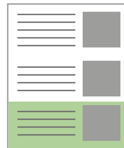
Bild: max. 50 KB, mind. 72 dpi, Dateiformat JPG, PNG oder GIF Zeichen: Text max. 400 Zeichen (mit Leerzeichen)

Bewerben Sie Ihr Produkt oder Neuheiten in einem ausgewählten Newsletter.